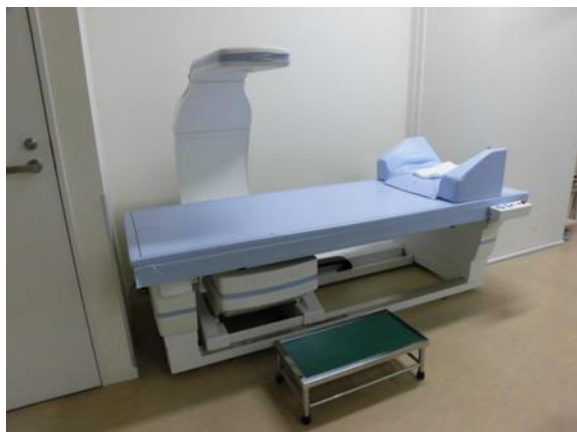
(装置 HOLOGIC 社製 HorizonA)

当院では平成 30 年 4 月より骨塩定量検査撮影のご依頼いただけるようになりました。当院の骨塩定量撮影は DEXA 法を用い、腰椎と大腿骨頸部の撮影を行い、骨密度の解析をしております。DEXA 法を用いた骨密度検査はほかの検査と比べ精度が高いのが特徴です。撮影部位は腰椎、大腿骨頸部で骨粗鬆症による骨折が生じやすい部位である為、測定することで直接的に骨の状態を評価することができます。検査時間は 15 分～20 分程度です。